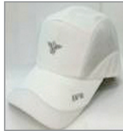
하절기 모자(흰색) 12,000원