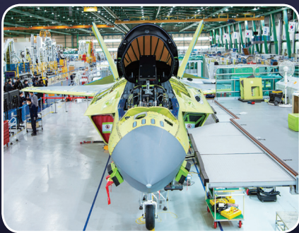
KF-21 최종 조립현장

KF-21 보라매를 개발하기 위한 우리의 노력은 대한민국 항공우주산업의 의지입니다. 우리의 오랜 염원과 노력을 담아 대한민국의 하늘에 한국형전투기가 날아오릅니다.