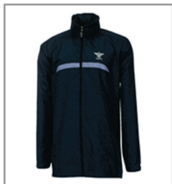
골프·등산용 재킷 25,000원