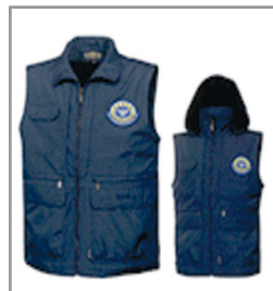
동절기 조끼 25,000원