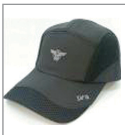
동절기 모자 15,000원