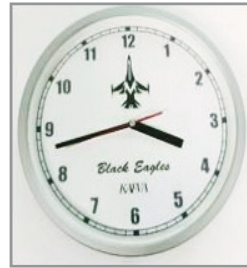
블랙이글스 벽시계 25,000원