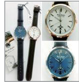
블랙이글스 손목시계 49,500원

인터넷 쇼핑몰 바로가기 www.airforce.ne.kr 전화주문 (02) 825-8461/2