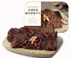
사대부집 '돼지양념구이' 부드러운 육질