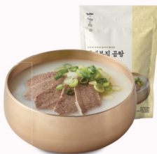
사대부집 '곰탕' 100% 원액 국물