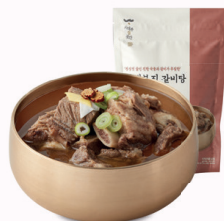
사대부집 '갈비탕' 진한 국물 맛