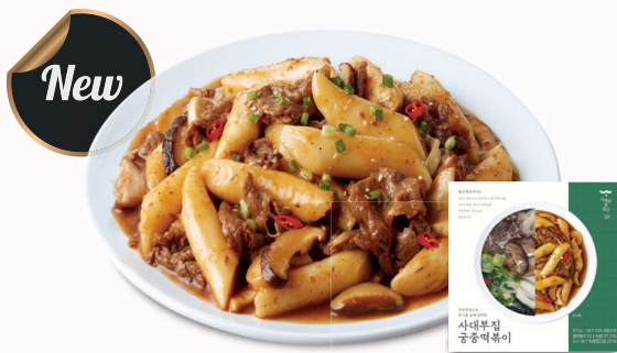
사대부집 궁중떡볶이 출시