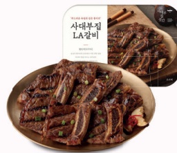
사대부집 'LA갈비' 두툼한 원육