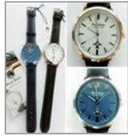
블랙이글스 손목시계 49,500원

인터넷 쇼핑몰 바로가기 www.airforce.ne.kr 전화주문 (02) 825-8461/2