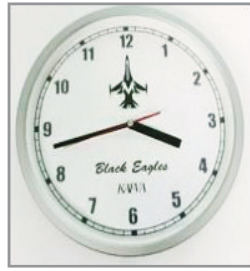
블랙이글스 벽시계 25,000원