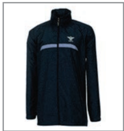
골프·등산용 재킷 25,000원