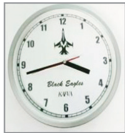
블랙이글스 벽시계 25,000원