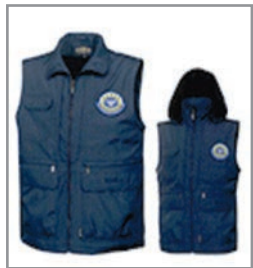
동절기 조끼 25,000원