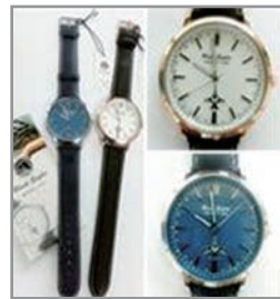
블랙이글스 손목시계 49,500원

인터넷 쇼핑몰 바로가기 www.airforce.ne.kr 전화주문 (02) 825-8461/2