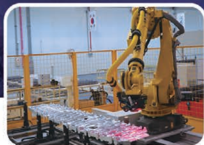
로봇을 활용한 스마트 팩토리