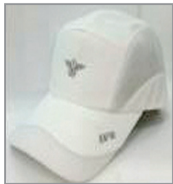
하절기 모자(흰색) 12,000원