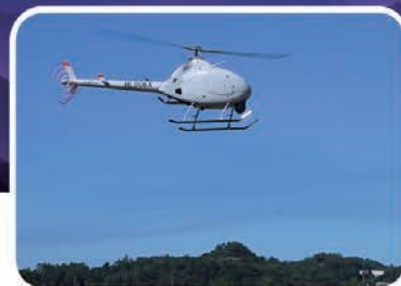
선형연구 중인 수직이착륙 무인기