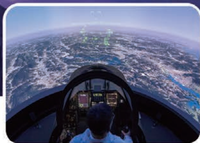
증강현실기술을 활용한 T-50 시뮬레이터

KAI 한국항공우주산업|주 KOREA AEROSPACE INDUSTRIES, LTD.