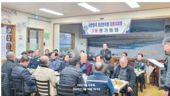
여 화기에애한 분위기 속에서 행사가 뜻깊게 마무리되었다.

강릉지회(지회장 최원규)는 1월 정기총회에 이어 3월 19일 시내 식당에서 다수의 회원이 참석한 가운데 정기회의를 진행하였다. 최원규 지회장은 인사말을 통해 “강릉 시민에게 봉사하는 전우회가 되자”고 다짐하며 중앙회 평생회원 가입을 적극 독려했다. 특히 이날 행사에는 김홍규 강릉시장(병 342기)이 직접 참석해 신규 회원 가입과 함께 평생회비를 납부하